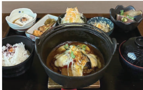
ビーフ煮込み風チーズハンバーグ