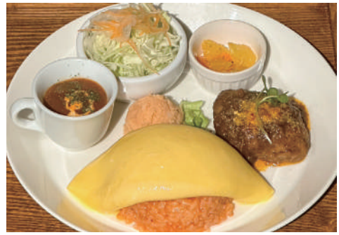
ここな洋風オムライス(ハンバーグ)