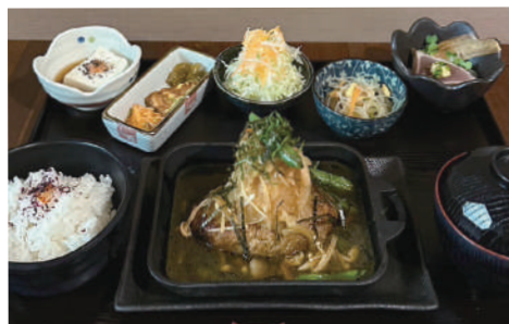
和風ステーキ風ハンバーグ