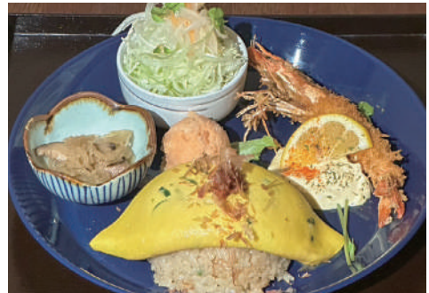
ここな和風オムライス(エビフライ)