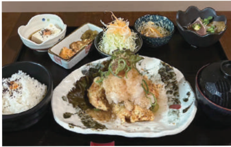
[元祖] 若鶏のからあげ梅おろし御膳