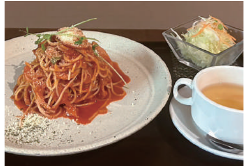
ここな風ナポリタン