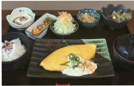
たらこチーズオムレツ御膳