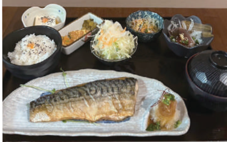
[元祖] とろ焼き鯖御膳